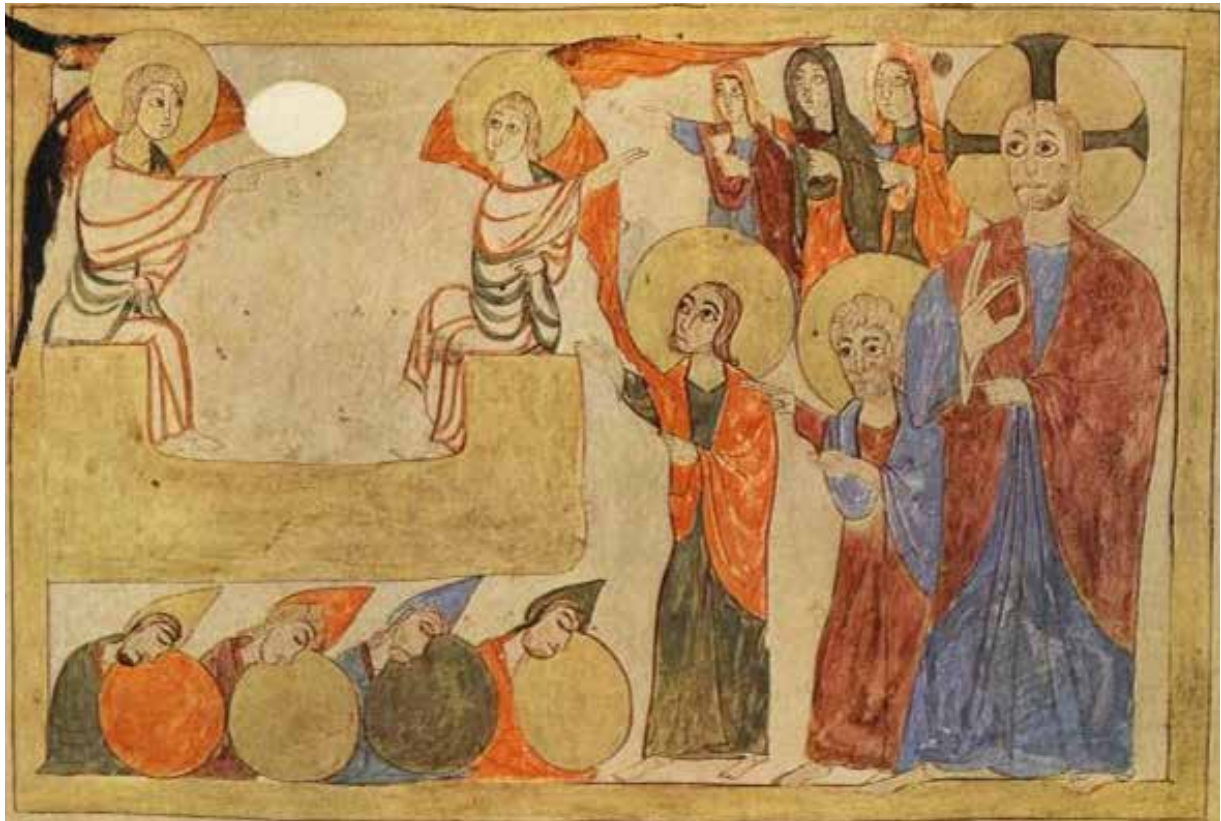
Աւետարան, 1038 թ. Զրեշտակի յայտնութիւնը իւղաբեր կանանց

Աւագ Չորեքշաբթի օրուայ աւետարանական ընթերցումը կը յորդորէ չարաշահել Աստուծոյ ունեցած սերն ու վստահութիւնը և, յիշելով մարդկութեան համար անոր կրած չարչարանքներն ու մահը, չշեղիլ ճշմարիտ ճանապարհէն, երկրպագել ու փառաւորել զԱստուած: