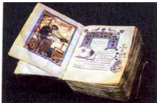
Միջնադարեան Հայ Չեռագիր, ԺԲ դար

Բոլորիս ծանօթ է նաեւ այն իրողութիւնը թէ առաջին գիրքը, որ հայերէնի կը թարգմանուի 408-415 թուականներուն միջեւ, Սուրբ Գիրքի Հին ուխտն էր կատարուած Եօթանասնիցէն: Նոյնքան հետաքրքրական է նաեւ զիտնալ թէ Նոր Ուխտի հայերէն լեզուով թարգմանութիւնը եղած է ասորերէն հին թարգմանութեան մը հետեւողութեամբ: Այս թարգմանութիւնն է որ կոչուած է «փութանակի թարգմանութիւն», որ կը նշանակէ հապճեպով, անապարանքով կատարուած թարգմանութիւն: