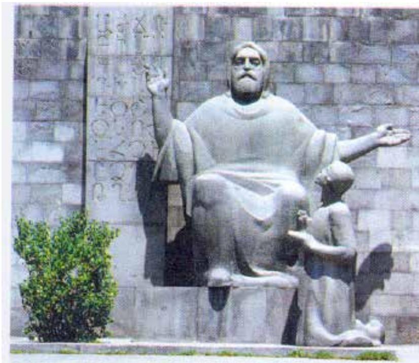
Մեսրոպ Մաշտոցի արձանը՝ Մատենադարանի մուտքին