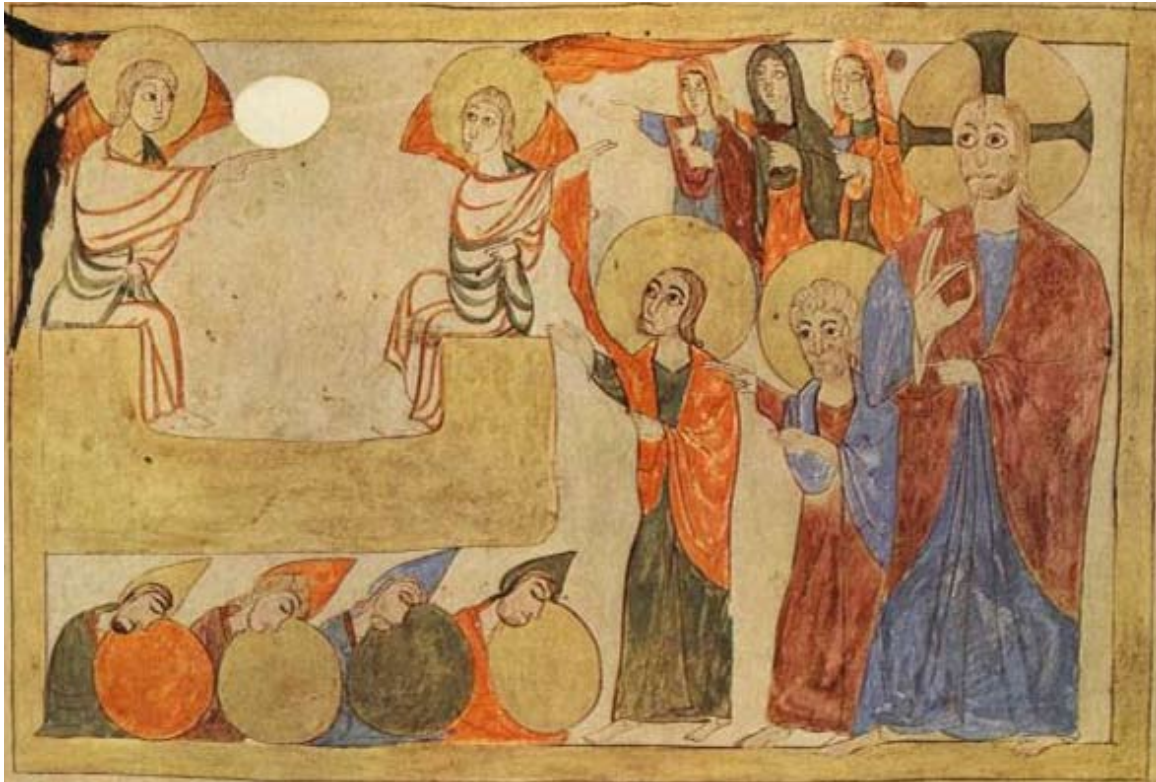
Աւետարան, 1038 թ. Զրեշտակի յայտնութիւնը իւղաբեր կանանց

Աւագ Չորեքշաբթի օրուայ աւետարանական ընթերցումը կը յորդորէ չչարաշահել Աստուծոյ ունեցած սէրն ու վստահութիւնը և, յիշելով մարդկութեան համար անոր կրած չարչարանքներն ու մահը, չշեղիլ ճշմարիտ ճանապարհէն, երկրպագել ու փառաւորել զԱստուած: