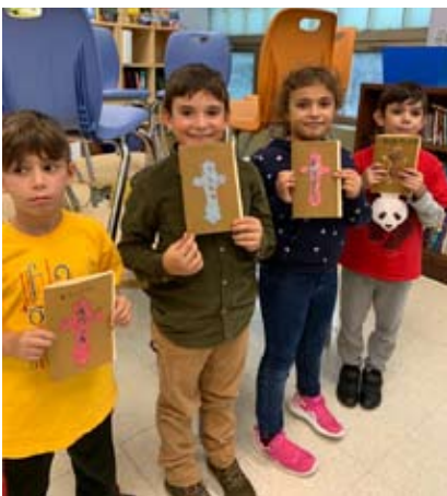
Նշելու համար Խաչվերացը, աշակերտները խաչեր պատրաստեցին...: