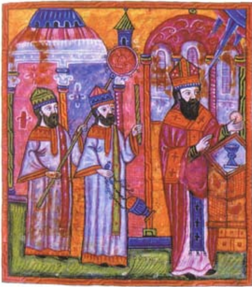
Ս. Մեծն Ներսէս պատարագ մատուցելու պահուն: Երևան Ձեռ. 2639 էջ 250ա Ժողովածու 1672թ. Ամբողջու վանք: Ծաղկող՝ Մահակ Վանեցի

Սուրբ Մեծն Ներսէս Ս. Գրիգոր Լուսաւորչի թորան թոռն է: Ան ուսանած է Կեսարիոյ մէջ: Հայրենիք վերադառնալէ ետք, Արշակ Բ. թագաւորը զինքը շնանակէ արքունի սենեկապետ, այնուհետեւ անոր շնորհելով հոգեւոր բոլոր աստիճանները, 353 թուին զինք կ'ուղարկէ Կեսարիա՝ օծուելու հայոց կաթողիկոս: Ըստ աւանդութեան՝ այնտեղ անոր հետ կը ձեռնադրուի նաեւ Սուրբ Բարսեղ Կեսարացին: