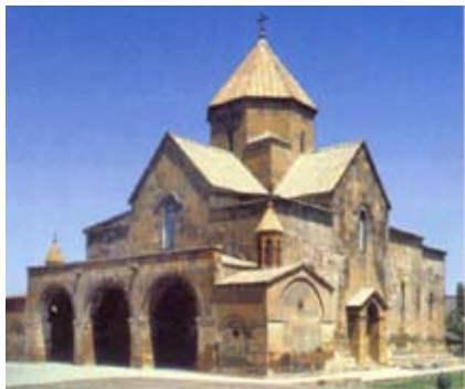
Էջմիածնի Ս. Գայիանէ Վանքը

Ստեփանոս Օրբելեանը կը գրէ թէ մինչեւ 13-րդ դար կաթողիկոսարանին մէջ կը պահուէին Հռիփսիմէի մասունքները, որոնք Հռոմկլայի գրաւման ժամանակ (1292) մամլուքները տարած են Եգիպտոս որպէս աւար: Հռիփսիմէի գերեզմանը կը գտնուի Էջմիածնի Սուրբ Հռիփսիմէ վանքին մէջ: