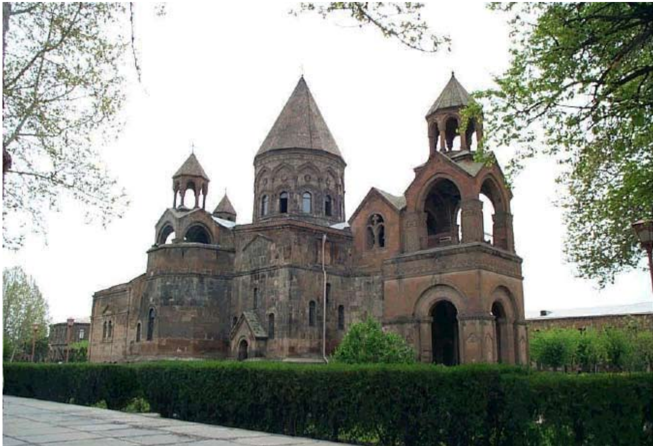
Ս. Էջմիածնի Մայր Տաճար