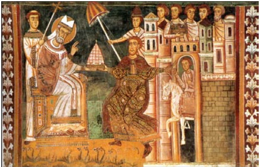
Միլվեսթր Ա. Հռոմի Պապը եւ Կոստանդիանոս կայսրը

Հեղինէ թագուհին Երուսաղէմի եւ շրջակայքին եկեղեցիներ եւ կուսանոցներ կառուցել կու տայ: Մահացած է 330 թուականին քրիստոնէաներու սրտերուն թողելով բարի յիշատակ: