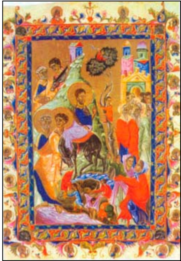
«Մուտք Երուսաղեմ» Մանրանկար՝ Յեթում Բ. Թագաւորի ճաշոցէն 1286 Կիլիկիա

- Կ'ըսեմ ձեզի, որ եթէ ատոնք լռեն՝ քարերը պիտի աղաղակեն: