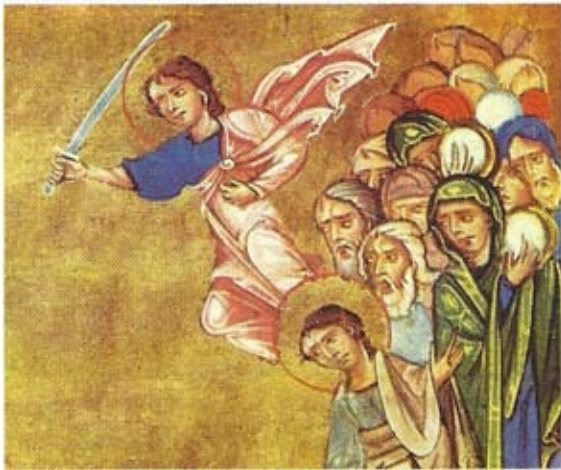
Միքայել հրեշտակապետը Իսրայելի ժողովուրդին համար մարտնչելու ընթացքին: Երուսաղէմ, ձեռ. 2027, էջ 4բ, Աստուածաշունչ 1266 թ. Կիլիկիա, ծաղկող Թորոս Ռոպին

Նոյեմբեր ամսուան առաջին կամ երկրորդ Շաբաթ օրը, Հայց. Եկեղեցին կը յիշատակէ հրեշտակապետեր Գաբրիելի եւ Միքայելի տօնը: Հրեշտակ կը նշանակէ պատգամաւոր, առաքեալ «ղրկուած»: Նախապէս անոր կը տրուէր երկնային դեսպան, պատգամաւոր, եւ կամ սուրհանդակ նշանակութիւնը: Աստուածաշունչը կը վկայէ որ հրեշտակները իբրեւ լուսեղէն՝ ստեղծուած են առաջին օրը, լոյսի հետ միասին: Անոնք ժամանակի ներգործութենէն չեն ազդուիր եւ սեռային յատկանիշներ չունին: