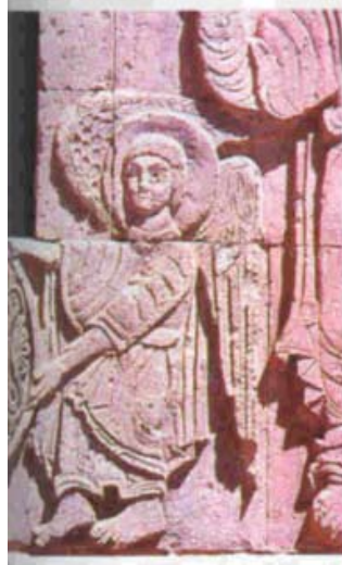
Հրեշտակի բարձրաքանդակը Աղթամար վանքի Ս. Խաչ եկեղեցւոյ ճակատին