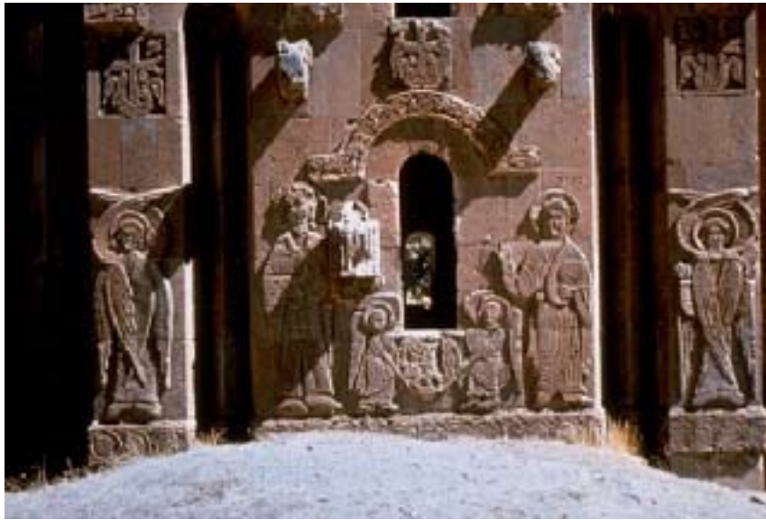
Հրեշտակներու քանդակներ Աղթամարի Սուրբ Խաչ եկեղեցւոյ ճակատին