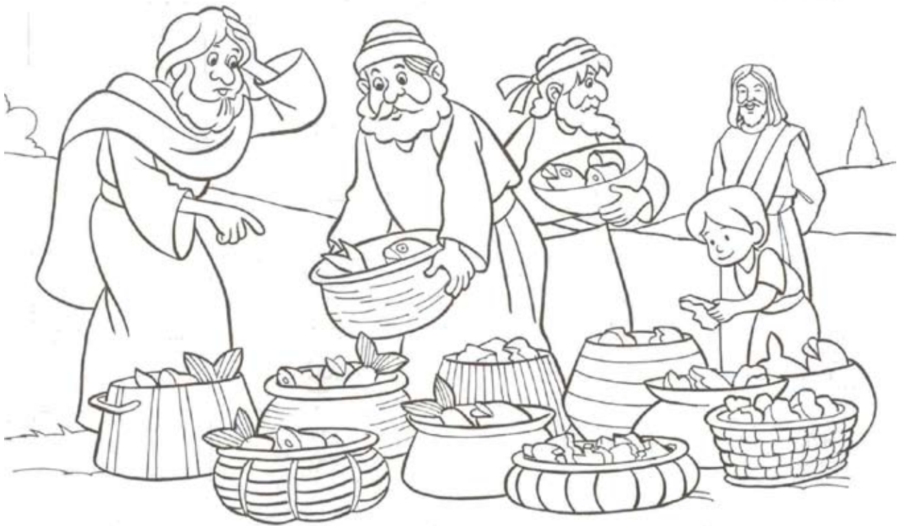
Ամէն մարդ կերաւ այնքան որ ուզեց: Եւ ինչ որ աւելցաւ, տասներկու կողով լեցուց:

Ամբողջացո՛ւր ըստ Ղուկասի Աւետարանին 9.14-17 .