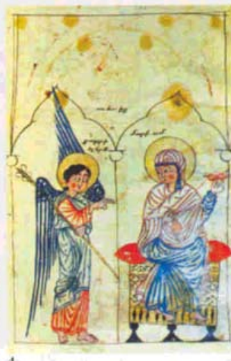
«Հրեշտակը եւ Ս. Մարիամը» 1330-ի Կիրակոս Աղբակեցիի «Աւետում» մանրանկարը