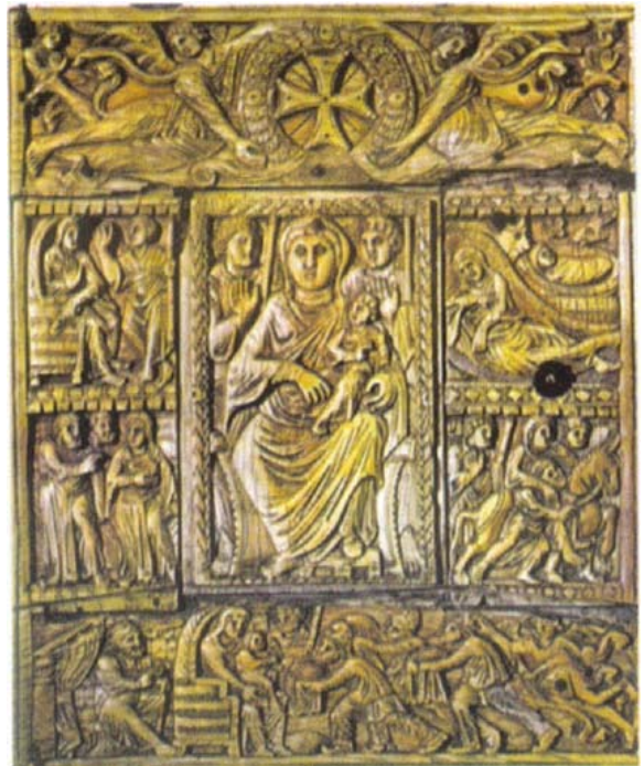
Էջմիածնի Աւետարանին Փղոսկրեայ կազմը

«Էջմիածնի Հոգեւոր Ճեմարան» Հոգեւոր բարձրագոյն գիշերօթիկ ուսումնական հաստատութիւն հիմնուած 1945 Նոյեմբեր 1-ին Գեորգ Չորեքեանի նախաձեռնութեամբ: 1998-ին Գարեգին Ա. Ամենայն Հայոց Կաթողիկոսի կողմէ վերանուանուեր է Գեորգեան Հոգեւոր Ճեմարան: