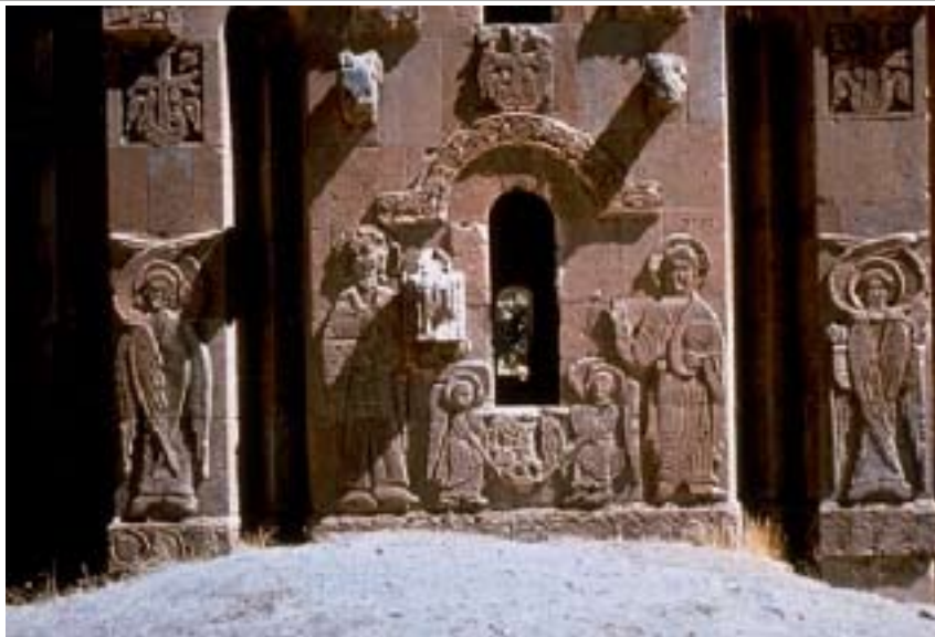
Հրեշտակներու քանդակներ Աղթամարի Սուրբ Խաչ եկեղեցւոյ ճակատին