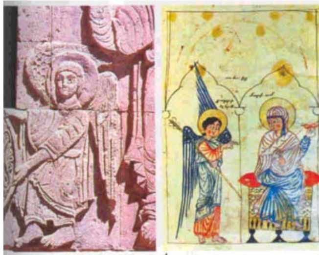
Հրեշտակի բարձրաքանդակը Աղթամար վանքի Ս. Խաչ եկեղեցւոյ ճակատին