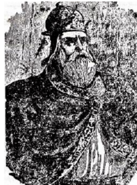
Տրդատ Գ. թագաւոր