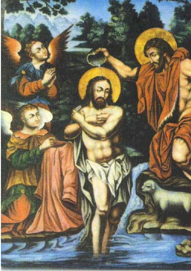
Մկրտություն Յոզաբան Յոզաբանեան

Ո՞վ չի գիտեր Սուրբ Ծնունդի մասին գրուած ամենաճանօթ այս շարականը որ կը հնչէ ամէն տարի խթման գիշերը աւետելու համար Յիսուսի ծնունդը: Այս շարականին հեղինակն է Մովսէս Քերթոզ Հայրապետ եւ զայն գրած է 441 թուականին: Ահա այդ շարականին գրաբար բառերը եւ աշխարհաբար թարգմանութիւնը.