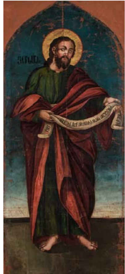
(անյայտ նկարիչ, ԺԸ դար)

Հայ Առաքելական Եկեղեցին Յոժսան մարգարէի յիշատակութեան օրը մշտապէս կը նշէ Առաջաւորաց պահքի աւարտին, որպէս խորհուրդ այն բանին, որ ճշմարիտ ապաշխարութեամբ կարելի է արժանանալ Աստուծոյ հաճութեան ու ողորմածութեան: