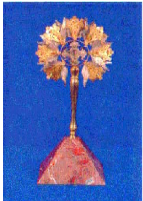
Ճաճանչ Ս. Յակոբի Մասունքին «մեր եկեղեցոյ Ս. Խորանին վրայ»: