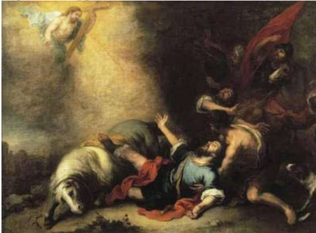
Bartolome Esteban Murillo (1618-1682), Le chemin de Damas , Musee du Prado, Madrid

Շնորհիւ իր բազմաթիւ բանաւոր քարոզներուն, գրած նամակներուն եւ առաքելական ճամբորդութիւններուն, տեսիլքներուն եւ յայտնութիւններուն ան կը նկատուի «հեթանոսներուն առաքեալ»ը: