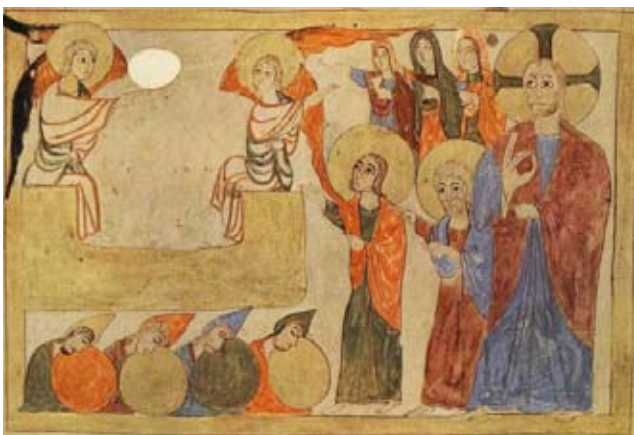
Աւետարան, 1038 թ. Հրեշտակի յայտնութիւնը իղարբեր կանանց

Աւագ Չորեքշաբթի օրուայ աւետարանական ընթերցումը կը յորդորէ չչարաշահել Աստուծոյ ունեցած սէրն ու վստահութիւնը և, յիշելով մարդկութեան համար անոր կրած չարչարանքներն ու մահը, չլեղիլ ճշմարիտ ճանապարհէն, երկրպագել ու փառաւորել զԱստուած: