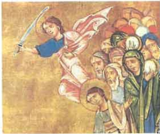
Միքայէլ հրեշտակապետը Իսրայէլի ժողովուրդին համար մարտնչելու ընթացքին: Երուսաղէմ, ձեռ. 2027, էջ 4բ, Աստուածաշունչ 1266 թ. Կիլիկիա, ծաղկող Թորոս Ռոսլին

Նոյեմբեր ամսուան առաջին կամ երկրորդ Շաբաթ օրը, Հայց. Եկեղեցին կը յիշատակէ հրեշտակապետեր Գաբրիէլի եւ Միքայէլի տօնը: Հրեշտակ կը նշանակէ պատգամաւոր, առաքեալ «ղրկուած»: Նախապէս անոր կը տրուէր երկնային դէսպան, պատգամաւոր, եւ կամ սուրհանդակ նշանակութիւնը: Աստուածաշունչը կը վկայէ որ հրեշտակները իբրեւ լուսեղէն՝ ստեղծուած են առաջին օրը, լոյսի հետ միասին: Անոնք ժամանակի ներգործութենէն չեն ազդուիր եւ սեռային յատկանիշներ չունին: