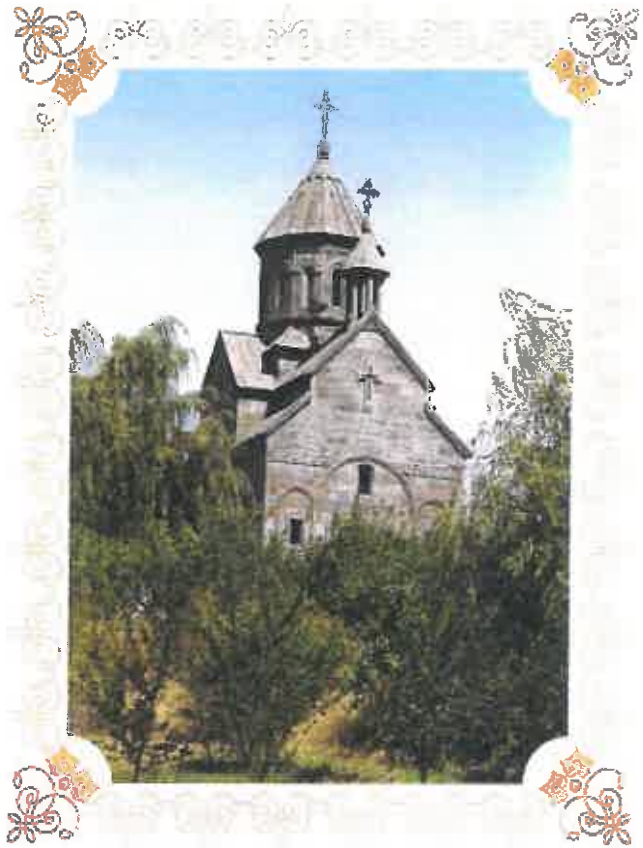
ԱՌԻՆՁԻ Ս. Աստուածածին Եկեղեցին 2000թ

Աստուածամօր երեք տարեկանին տաճար ընծայման տօնը, անփոփոխ կերպով կը կատարուի 21 Նոյեմբերին: