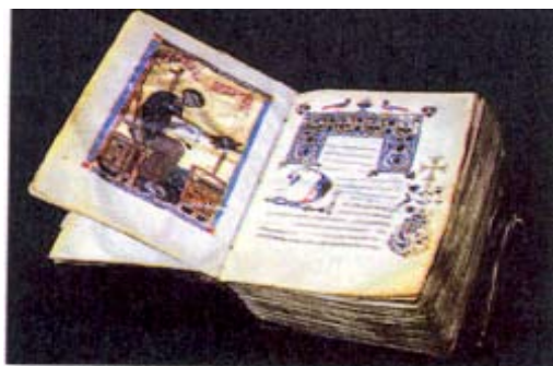
Միջնադարեան Հայ Ձեռագիր, ԺԲ դար

Հայ Գրչութեան Կեդրոնները Հայ գրչութեան առաջին կեդրոնը Վաղարշապատն է: Այստեղ Ե. դարէն սկսեալ գրուած, ընդօրինակուած եւ Հայաստանի տարբեր կողմերը դրկուած են հայերէն ձեռագիրներ: Ասոնք իրենց կարգին կրկին ընդօրինակուելով բազմացուած են գրչութեան նոր կեդրոններու մէջ: