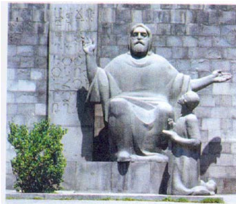
Մեսրոպ Մաշտոցի արձանը՝ Մատենադարանի մուտքին