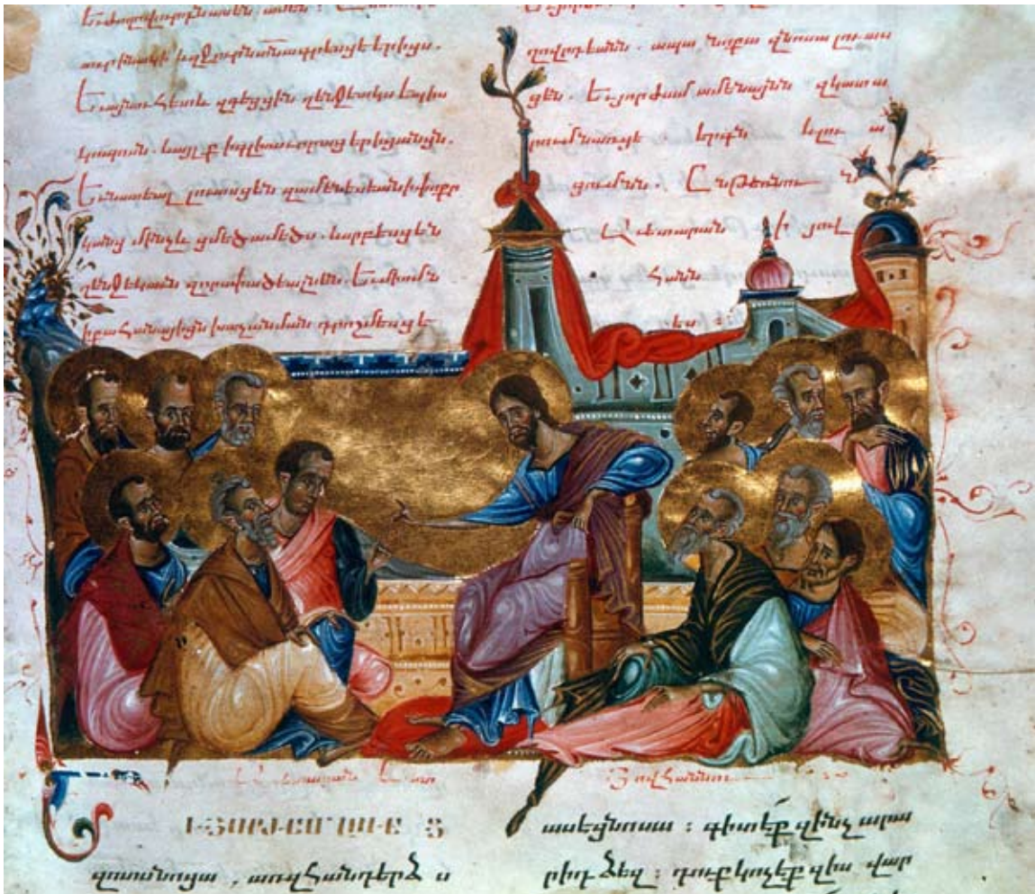
Յիսուս կը քարոզէ Առաքեալներուն