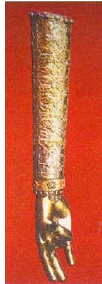
Մ ու Ր Բ Գ Ր ի գ ո Ր Լ ո ս ա Վ ո Ր ի չ ի Ա ջ Ր

Գարնանաբեր հնչու՞՞ն հարաւային հողմոյն. ճառագայթեալ հրով աստուածային Հոգւոյն. որով հալեցաւ սառն կռապաշտութեան հիւսիսաբնակ ազանց. եւ եղեն ծաղկեալք աստուածային գիտութեամբն: