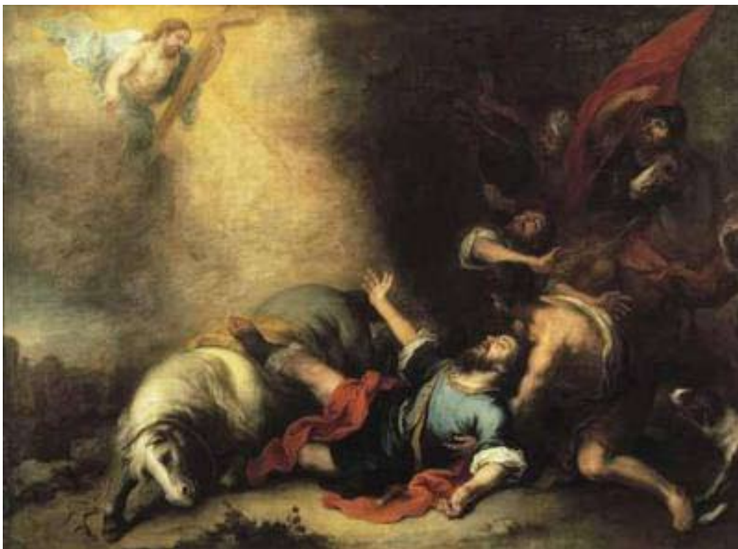
Bartolome Esteban Murillo (1618-1682)

Շնորհիւ իր բազմաթիւ բանաւոր քարոզներուն, գրած նամակներուն եւ առաքելական ճամբորդութիւններուն, տեսիլքներուն եւ յայտնութիւններուն ան կը նկատուի «հերթանոսներուն առաքեալ»ը: