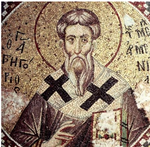
Սբ. Գրիգոր Լուսաւորչի Բիւզանդական Սրբապատկեր

«Տեսանելին անտեսանելիին մէջ», յաճախ այսպէս կը բնորոշենք սրբապատկեր հասկացողութիւնը: Եւ այդ բնորոշումը լիովին կը համապատասխանէ իրականութեան, քանի՛ «ես կ'ընթանայի դէպի առաջ, որպէսզի տեսնեմ եւ ճանչնամ Աստուծոյ: Ուստի ես կտրուեցայ նիւթէն ու մարմնական աշխարհէն: Ես հաւաքուեցայ ինքս իմ մէջ որքան որ կրնայի եւ բարձրացայ լերան գագաթը: Բայց երբ աչքերս բացի, Աստուած տեսայ միայն ետեւէն, որ Բանի մարդեղութեամբ մարմնաւորուած էր մեր փրկութեան համար: Ես չի կրցայ տեսնել Ամենասուրբ Գերբնութիւնը Ինքն Իրմով՝ Սուրբ Երրորդութեամբ ճանչցուող: Քանի որ ես չէի կրնար տեսնել այն ինչ որ հրեշտակներով ծածկուած էր՝ այլ միայն տեսայ այն՝ այսինքն Արարածին մէջ տեսանելի Աստուածային Հրաշակերպութիւնը որ դէպի մեզ կու գար» Սուրբ Գրիգոր Աստուածաբան: