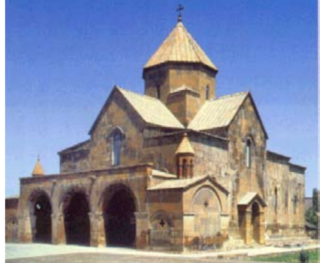
Էջմիածնի Ս. Գայիանե Վանքը