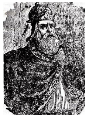
Տրդատ Գ. թագաւոր