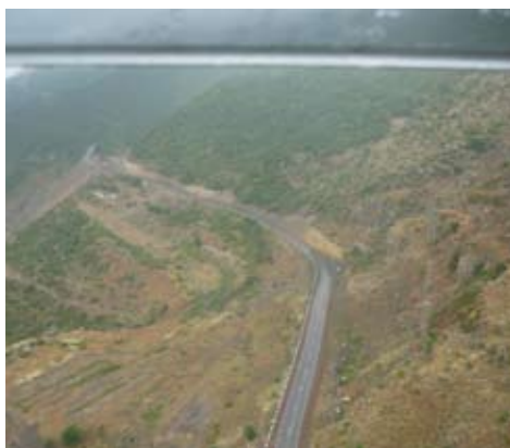
Ճոպանուղիէն վար դիտուած

Ճոպանուղին կը շարժի ժամական 37 քմ արագութեամբ եւ 11 վայրկեանէն Հալիձորէն Սարթեի վանք կը հասնի: