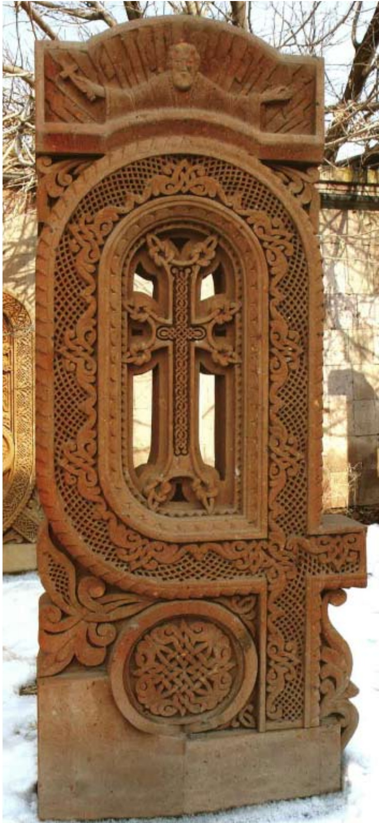
Գանձը ողորմութեան, Գանձիդ ծածկելոյ, Գտող զիս արա: