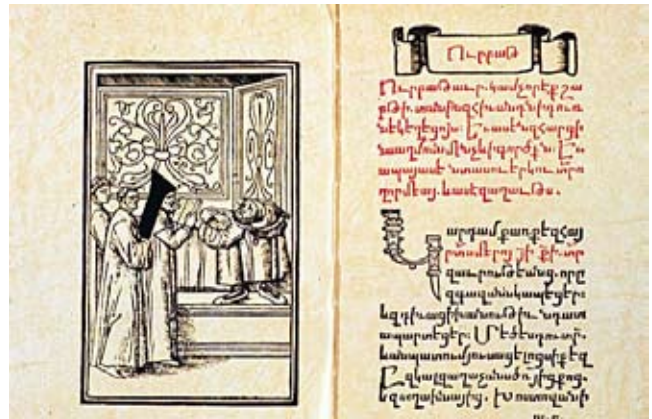
Հայկական առաջին տպագիր գիրքը

Առաջաւորաց պահքը կամ Առաջաւորքը՝ Հայ Առաքելական Եկեղեցոյ առաջին պահքը (ինչպէս յայտնի է անունէն): Պահքի առաջին 4 օրերուն ճաշու աւետարան չի կարդացուիր իսկ 5-րդ օրը կը կարդացուի Յովսէփ Մարգարէի գիրքը: