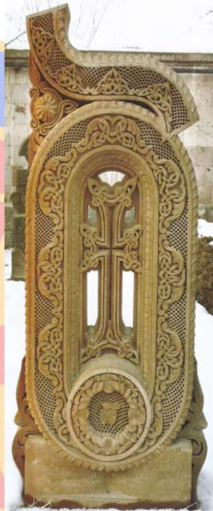
Խաչքարի Հեղինակ՝ Ժողովրդական Վարպետ, Ռուբեն Նալբանդյան

Ծ...Քրիստոս Ծնաւ եւ Յայտնեցաւ Օրհնեալ է Յայտնութիւնն Քրիստոսի