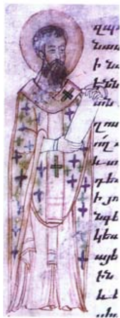
Ս. Աթանաս Աղեքսանդրիացի Երեւան, ձեռ. 7478 էջ 28բ, Յայսմաւուրք ԺԶ-ԺԷ դար, ծաղկող՝ Թորոս