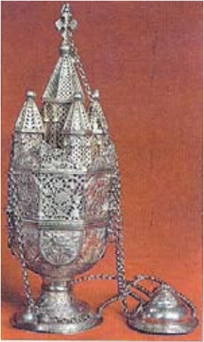
Բուրվառ ԺԸ դար, Վաղարշապատ, Ս. Էջմիածնի գանձատուն

ԲՈՒՐՎԱՌ ը կիսագունդ պարունակ մըն է, որ որպէս կրակարան կը խորհրդանշէ հաւատացեալներու սիրտն ու հոգին: Կրակարանը կապուած է երեք շղթաներով որոնք վերէն իրար միացած են կը խորհրդանշեն Ս. Երրորդութիւնը: Շղթաներուն վրայ կը գտնուին չորսական բռժոժներ, կը խորհրդանշեն տասներկու առաքեալները որոնք իրենց հնչեղութեամբ Քրիստոսի վարդապետութիւնը տարածեցին աշխարհին: Կրակարանին վրայ խունկի աւելցումով արձակուած ծուխը հաւատացեալներու աղօթքները կը խորհրդանշէ, որոնք երկինք կը բարձրանան առ Աստուած: Հին կտակարանի համաձայն հաւատացեալներու աղաչանքն է Աստուծոյ, որ իր աղօթքները ընդունի: