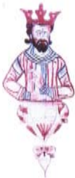
Աբգար Թագաւոր Երեսն, ձեռ. 7361 էջ 213ա, Յայտնաւորք XVդ., Տաթեւ

Ս. Աբգար, ըստ աւանդութեան՝ Ա. դարու անդրանիկ քրիստոնէայ թագաւորը, պարթեւ Արշակունի Արշամի որդին էր: Իր թագաւորութեան մայրաքաղաքը Եդեսիան էր: Ըստ Մովսէս Խորենացիի, ան հայոց թագաւորն էր: Մովսէս Խորենացին նաեւ կը գրէ թէ Աբգար թագաւոր լսեր է Յիսուսի հրաշքներուն մասին եւ հաւատացեր է որ Յիսուս ճշմարիտ Աստուծոյ որդին է, եւ նամակ ուղարկած է Յիսուսի որ գայ եւ զինք բժշկէ բորոտութենէ: Յիսուս կը խոստանայ զրկել իր աշակերտներէն մէկը որ բժշկէ զինք եւ կեանք շնորհէ իրեն եւ իր հետ եղողներուն: Յիսուսի համբարձումէն ետք, Ս. Թադէոս Առաքեալ կ'ուղուի դէպի Եդեսիա եւ կը բժշկէ Աբգար թագաւորը եւ իր հետ եղողները: Ասկէ ետք Ս. Թադէոս Առաքեալ կ'ուղուի Աբգար թագաւորի քեռիին որդիին՝ Սանատրուկ թագաւորի պալատը: Մեր եկեղեցին Ս. Աբգար թագաւորի տօնը կը յիշատակէ ընդհանրապէս Յիսնակի Ե. Կիրակիին նախորդող Շաբաթ օրը: