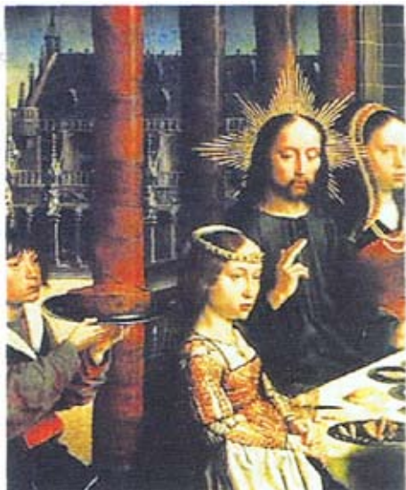
Յիսուս խորհուրդներ կու տայ

Քրիստոս կ'ուսուցանէր որ բոլոր անոնք որոնք կը հետեւին իր խրատներուն կը նմանին այն իմաստուն մարդուն որ իր տունը ամուր հիմի վրայ կը կառուցէ: Ինչպէս քամիներն ու անձրեւները չեն կրնար վնասել այդ տանը, որովհետեւ անոր հիմը զօրաւոր է, այնպէս ալ կեանքի փորձութիւնները չեն կրնար վնասել իր խրատներուն հետեւող մարդոց: Այդպիսի մարդիկ սիրելի են Աստուծոյ: