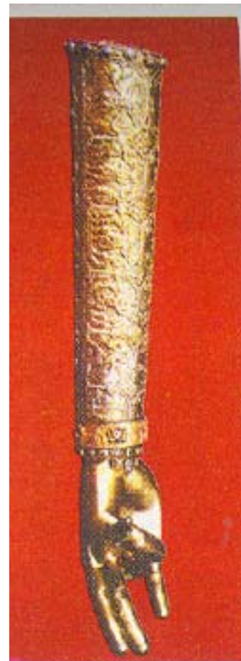
Սուրբ Գրիգոր Լուսավորիչի Աջը

Ծարական նուիրուած Սուրբ Գրիգոր Լուսավորիչի Քրիստոսը դաւանող վկայ ճշմարիտ, Բազմաշարժար նահատակ Գրիգոր Հայրապետ: Տիրոջ չարչարանաց պակասը քու մարմնոյդ վրայ լրացուցիր Որով կը ցնծայ Եկեղեցին Սիոնի որդւոց փառքով: