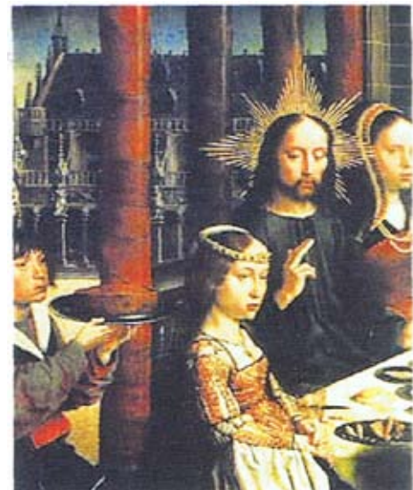
Յիսուս խորհուրդներ կու տայ

Քրիստոս կ'ուսուցանէր որ բոլոր անոնք որոնք կը հետեւին իր խրատներուն կը նմանին այն իմաստուն մարդուն որ իր տունը ամուր հիմի վրայ կը կառուցէ: Ինչպէս քամիներն ու անձրեւները չեն կրնար վնասել այդ տանը, որովհետեւ անոր հիմը զօրաւոր է, այնպէս ալ կեանքի փորձութիւնները չեն կրնար վնասել իր խրատներուն հետեւող մարդոց: Այդպիսի մարդիկ սիրելի են Աստուծոյ: