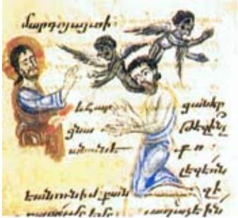
Յիսուս կը բուժէ հիւանդին