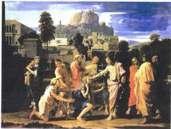
Յիսուս կը բուժէ կոյրին

Իշխանաւորներն ու փարիսեցիները նախանձով ու չարութեամբ լեցուեցան Յիսուսի նկատմամբ, որովհետեւ ան իր առակներու եւ զրոյցներու միջոցաւ ցոյց կուտար ու կը դատապարտէր անոնց ազահութիւնն ու կեղծաւորութիւնը: