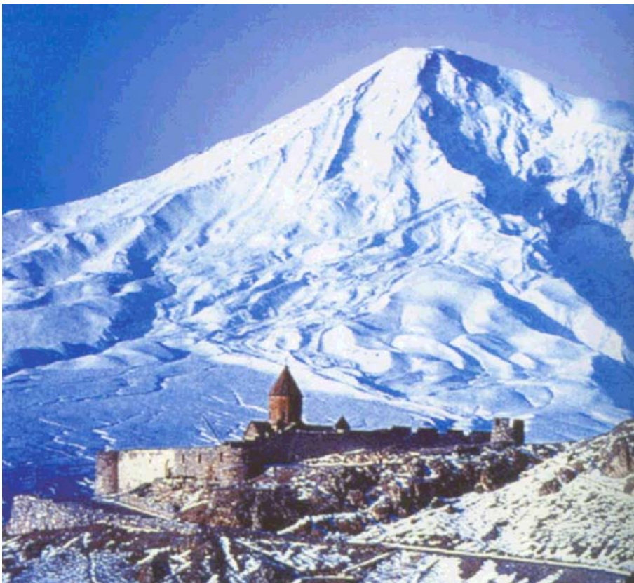
Խոր Վիրապի վանք

Հայաստանեայց եկեղեցին տարին մի քանի անգամ կը յիշատակէ Սուրբ Գրիգորի անունը, հիմնուելով անոր կեանքի յատկանշական հանգրուաններուն վրայ: Այսպէս՝ Խոր Վիրապ մտնելը, Խոր Վիրապէն ելլելը եւ «Գիւտ նշխարաց»-ը: