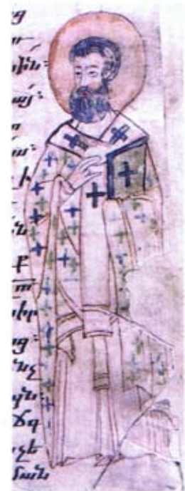
Ս. Գրիգոր Աստուածաբան Երեւան, ձեռ. 7478 էջ 41ա, Յայսմաուրբ XVI-XVII դդ., ծաղկող՝ Թորոս

Տիեզերական վարդապետ, իր ծննդավայրի անունով կը կոչուի նաեւ Գրիգոր Նազիանզացի: Ան ծնաւ իր մօր աղօթքներով, որ արու զաւակ չունէր եւ այդ կը խնդրէր Աստուծմէ: Գրիգորը ուսանեցաւ Կեսարիոյ, Պաղեստինի, Աղեքսանդրիոյ եւ Աթէնքի մէջ ստանալով փիլիսոփայական եւ հռետորական կրթութիւն: Աթէնքի մէջ անոր ընկերակիցն էր Բարսեղ Կեսարացին, եւ երկուքը մարդոց ուշադրութիւնը կը գրաւէին իրենց ժուժկալութեամբ եւ ճգնութեամբ հիացմունք պատճառելով քաղաքի բնակիչներուն: 361 թուականին քահանայ ձեռնադրուելով՝ ան դարձաւ Նազիանզի եկեղեցոյ Առաջնորդը: Իսկ 381 թուականին նշանակուեցաւ Կոստանդնուպոլսոյ Եպիսկոպոս: Ան մասնակցեցաւ Բ. Տիեզերական ժողովին 381 ին Կոստանդնուպոլսոյ մէջ: