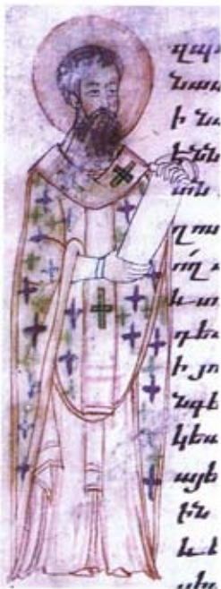
Ս. Աթանաս Աղեքսանդրիացի Երեւան, ձեռ. 7478 էջ 28բ, Յայսմաուրբ XVI-XVII դդ., ծաղկող՝ Թորոս