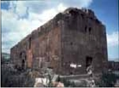
Լեռնակերտի եկեղեցին, Ե-Է դար, միանաւ կառուցով

301 թուին իսկ, Հայաստանը, դառնալով աշխարհի մէջ առաջին պետութիւնը որ ընդունեց քրիստոնէութիւնը որպէս պետական կրօն, ունեցած է եկեղեցիներու ինքնուրոյն տիպար որ եղած է բարձր մակարդակով եւ հարուստ գեղագիտական ասանդներով: Ըստ Փաւստոս Բիւզանդի, Գրիգոր Լուսաւորիչ եւ Տրդատ թագաւոր սկզբնական շրջանին հեթանոսական քանդուած տաճարներու հիմերուն վրայ կառուցած են եկեղեցիները, կամ այդ տաճարները բարեփոխութիւններու ենթարկելով՝ վերածած եկեղեցիներու: Այս պարագային բեմը փոխադրած են դէպի Արեւելք եւ գործածած են իբր խորան: Ազգաթանգեղոս կը պատմէ թէ առաջին եկեղեցիներու ճարտարապետը ինքը՝ Գրիգոր Լուսաւորիչը կը նկատուի: