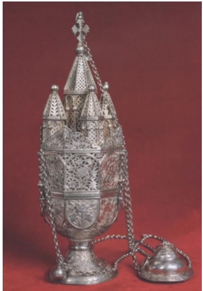
Արծաթեայ բուրվառ– 18–րդ դար

Այս խօսքով կը խնդրեն քահանայէն որ պատարագ ընծայած ընթացքին յիշէ նաեւ հաւատացեալ ժողովուրդը: