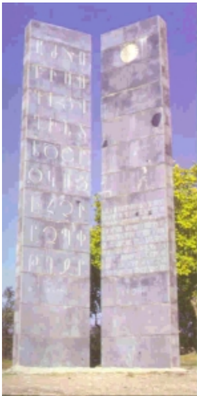
Յուշարձան Օշականի մէջ

Հայ ժողովուրդը մեր այբուբենի հայր՝ Մեսրոպ Մաշտոցին կը պարտի ապահոված ըլլալ մեր ազգային ինքնութեան անկախացումն ու յանրապետութիւնը, շնորհիւ հայաստան գրականութեան ստեղծման: Ան 1600 տարիներէ ի վեր կը նկատուի մեր ժողովուրդի ամենէն սուրբ դէմքը: