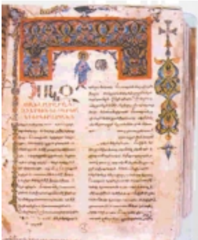
Աստուածաշունչի Հայերէն ձեռագիր 1265 Թ