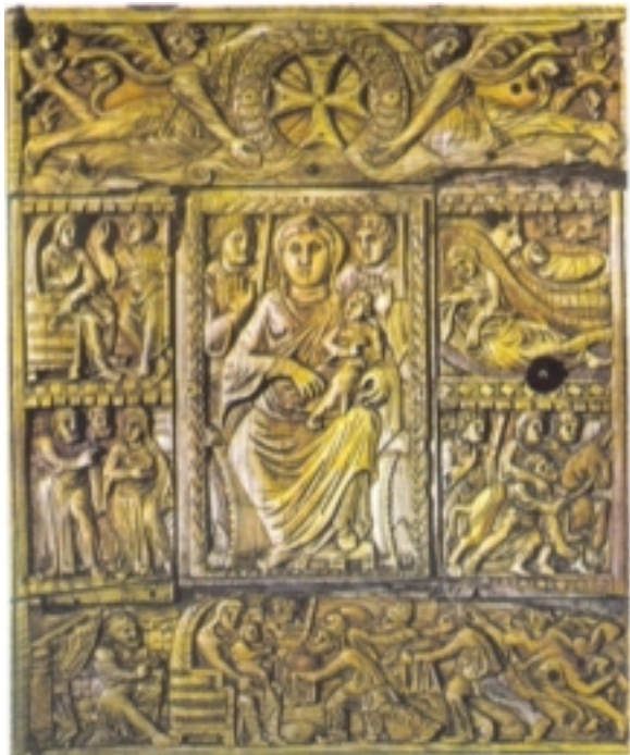
Էջմիածնի Աւետարանին Փղոսկրեայ կազմը

«Էջմիածնի Հոգեւոր Ծեմարան» Հոգեւոր բարձրագոյն գիշերօթիկ ուսումնական հաստատութիւն հիմնուած 1945 Նոյեմբեր 1 ին Գեորգ Չորեքեանի նախաձեռնութեամբ: 1998 ին Գարեգին Ա. Կաթողիկոսի կողմէ վերանուանուեր է Գեորգեան Հոգեւոր Ծեմարան: