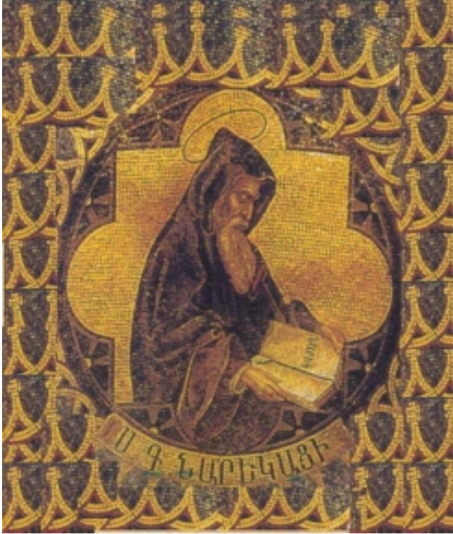
Նարեկ Բան խա. (հատուած)

Կենդանի Աստուծոյ ամէնօրհեալ Որդի, ահաւոր Հօրդ անքնին ծնունդն ես Դուն, Քեզի համար չկայ բնաւ անկարելի բան. Քու ողորմութեանդ փառքին անստուեր նշոյլները երբ կը ծագին, մեղքերը կը հալին, դեւերը կը հալածուին, յանցանքները կը ջնջուին, կապանքները կը խզուին, շղթաները կը խորտակուին, մահացածները կը կենդանաձնին, հարուածները կը բժշկուին, վէրքերը կ'առողջանան, ապականութիւնները կը վերցուին, տխրութիւնները տեղի կու տան, հեծութիւնները կը նահանջեն, խաւարը կը փախչի, մէգը կը մեկնի, մառախուղը կը հեռանայ. մոռայլը կը փարատի, աղջամուղջը կը սպառի, մութը կը վերնայ, գիշերը կ'անցնի, տագնապը կը