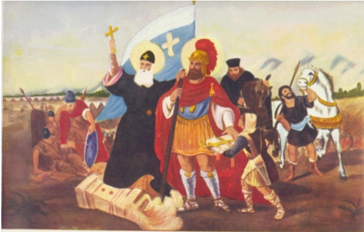
ՔԱՁՆ ՎԱՐԳԱՆ ՄԱՍՏՐԿՈՆԵԱՆ ԵՒ ՂԵՒՈՆԴ ԵՐԷՅ

Ընդհանրապէս, երբ դպրոցական տարիքի մանուկներու եւ պատանհներու հարցնենք թէ ի՞նչ սորված են Վարդանանց պատերազմի մասին, անոնց գիտութիւնը կ'ամփոփուի Տղմուտ գետի ափին տեղի ունեցած այդ հայրենասիրական պատերազմին շուրջ, 60 000 կտրիճներով, թշնամիին անհամար բանակին եւ փիղերուն դէմ: Սակայն ուրիշ ի՞նչ պէտք է սորվիլ Վարդանանց պատերազմէն, ի՞նչ հասկնալ, ի՞նչ եզրակացնել: