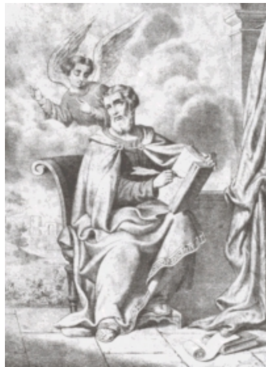
Ս. Ղուկաս Աւետարանիչ