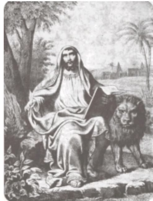
Ս. Մարկոս Աւետարանիչ