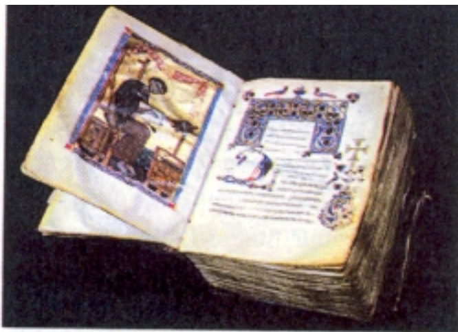
Միջնադարեան Հայ Ձեռագիր 12-րդ դար

Այսօր, աշխարհի ամէն կողմէն մարդիկ կ'այցելեն «հսկային», կը լսեն անոր պատմութիւնը ու կը հիանան զայն ազատող երկու հայուհիներուն քաջութեան վրայ: