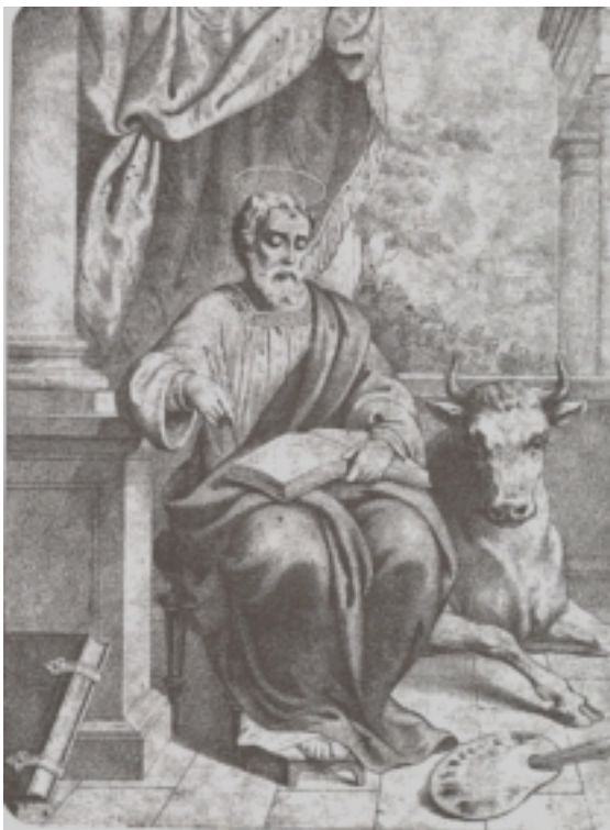
Ս. Մատթէոս Աւետարանիչ

Յովհաննէս՝ Յիսուսի 12 Առաքեալներէն կրտսերագոյնն է: Յովհաննէսի Աւետարանը յատկանշական կերպով տարբեր է միւս աւետարաններէն: Անկէ Յիսուսը կը ներկայացնէ որպէս Աստուծոյ Խօսքը որ մարմին եղաւ եւ մեր մէջ բնակեցաւ: Ինչպէս հեղինակը կ'ըսէ, այս Աւետարանը գրուեցաւ որպէսզի ընթերցողները հաւատան թէ Յիսուսն է խոստացուած Փրկիչը, Աստուծոյ Որդին, եւ յաւիտենական կեանք ունենան ( 20:31) : Յովհաննէս կը շեշտէ յաւիտենական կեանքի շնորհքը, որ մենք պիտի ստանանք Յիսուսի միջոցաւ: Յատկանշական է որ այս աւետարանը որեւէ առակ չի պարունակէր: