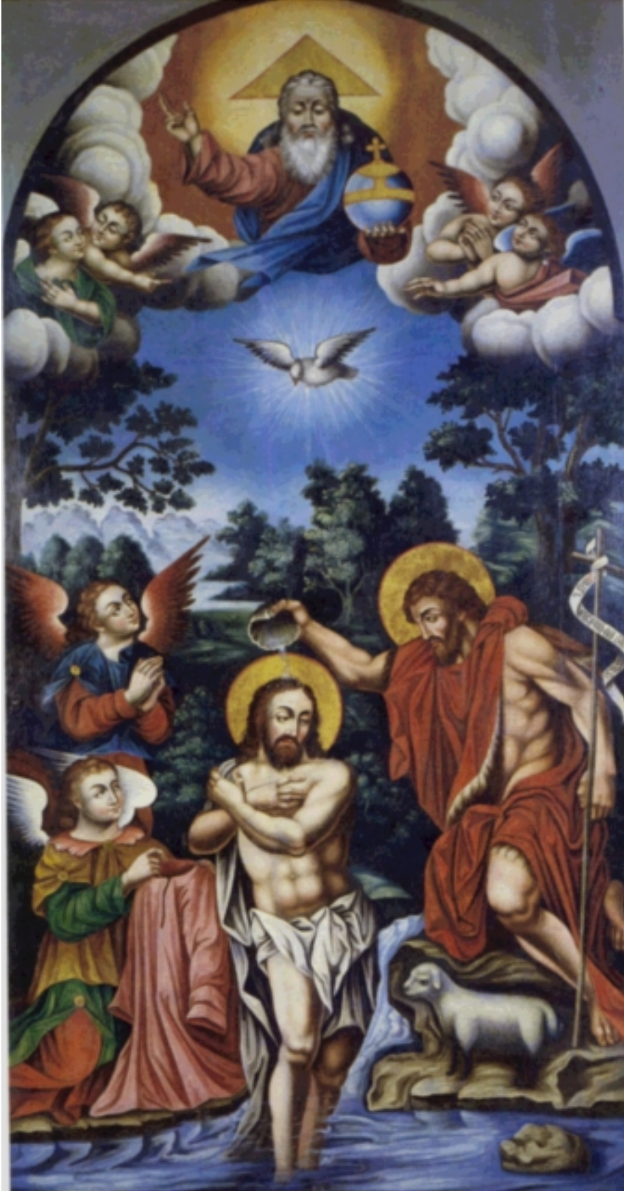
Մկրտութիւն Յովնաթան Յովնաթանեան

1. Յիսուս քանի՞ տարեկան էր երբ մկրտուեցաւ: ա. 1 բ. 12 գ. 30 դ. 33