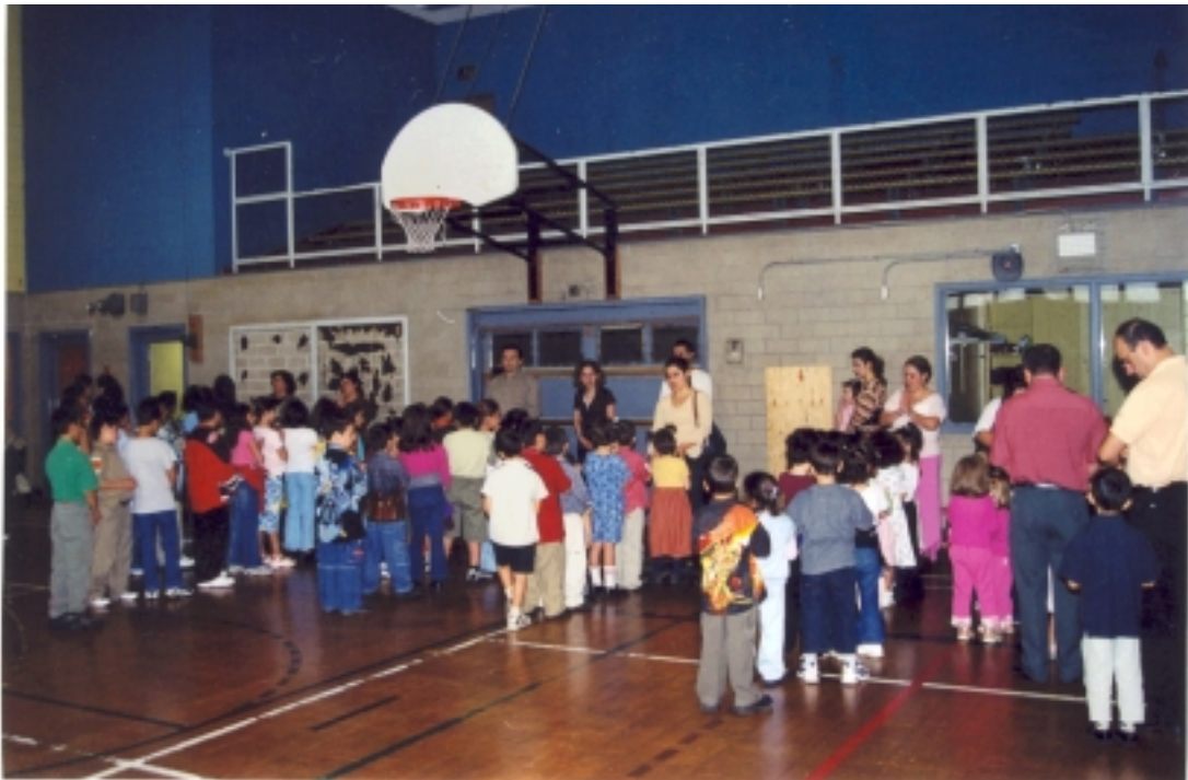
Տէրունական Աղօթքով Կը սկսինք մեր Օրը