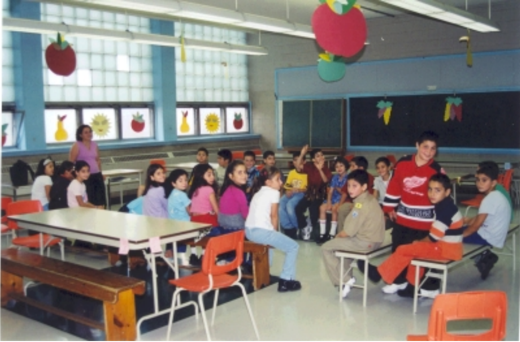
Նախ. Ա. Բ. Գ եւ Դ. լսարանային բաժին