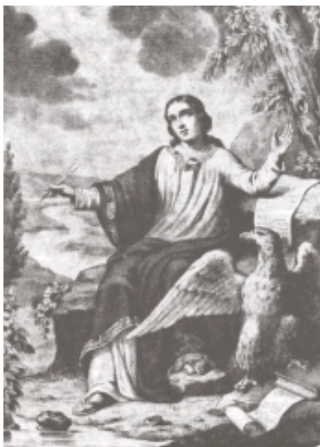
Ս. Յովհաննէս Աւետարանիչ

Հեղինակին մասին ծանօթութիւններ ունինք Նոր Կտակարանի 5-րդ, «Առաքեալներու Գործերը», գիրքէն որ գրուած է Ղուկաս Աւետարանիչին կողմէ եւ առաքելական նամակներէն: Մարկոսի Աւետարանը կը սկսի հաստատումով, թէ Յիսուս Քրիստոս Աստուծոյ Որդին է: Մարկոսի Աւետարանին մէջ Յիսուսի պատմութիւնը ներկայացուած է իր կատարած